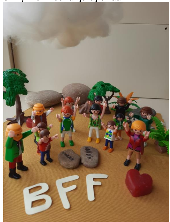
Deuteronomium 4: 32-40

Mozes vertelt aan zijn volk dat ze zich altijd aan Gods geboden moeten houden. Daarbij doet hij een beroep op de geschiedenis die God en zijn volk samen hebben; wat zij samen meegemaakt hebben, is nog nooit ergens anders gebeurd. Daarom horen God en zijn volk voor altijd bij elkaar.